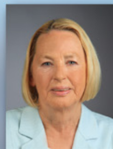
Listenplatz 3 Petra Joumaah Landtags-abgeordnete 65 Jahre