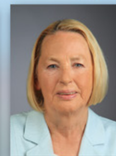
Listenplatz 2 Petra Joumaah Landtags- abgeordnete 65 Jahre